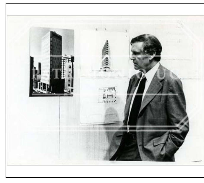
Fotografía b/n FED - F02-0023