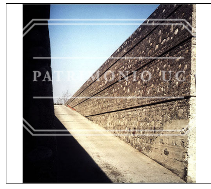
Fotografía color FED - F02-0027