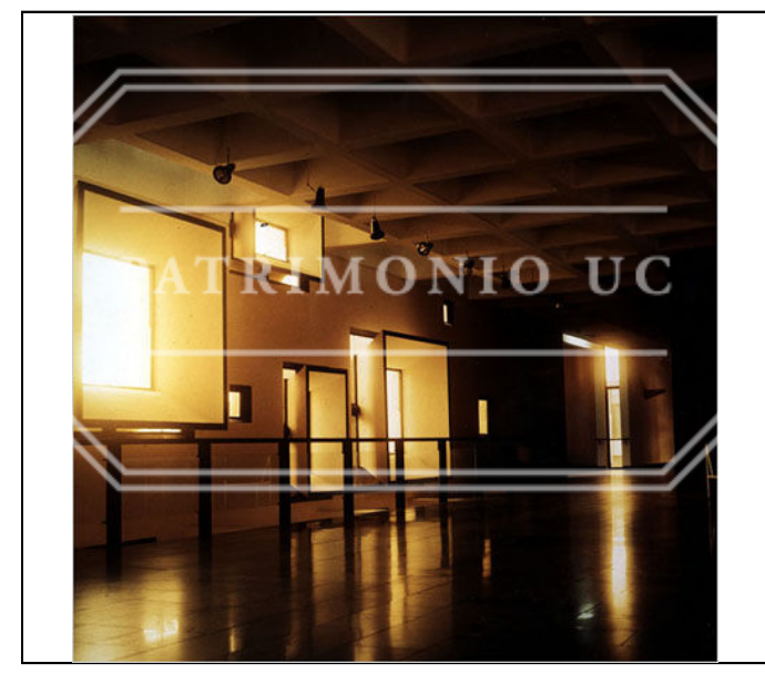
Fotografía color FED - F02-0029