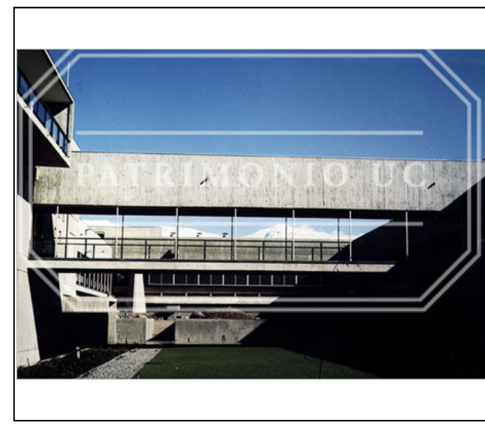
Fotografía color FED - F02-0032