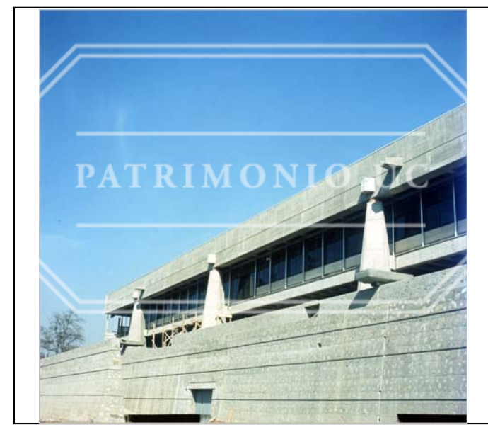
Fotografía color FED - F02-0034