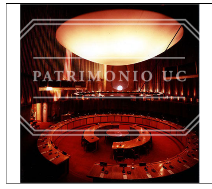
Fotografía color FED - F02-0036