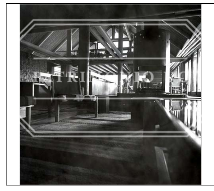
Fotografía b/n FED - F02-0085