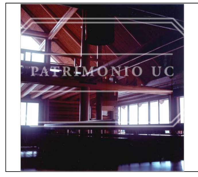
Fotografía color FED - F02-0087