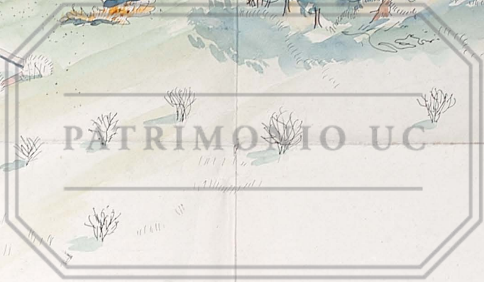
- vista desde el cerro -