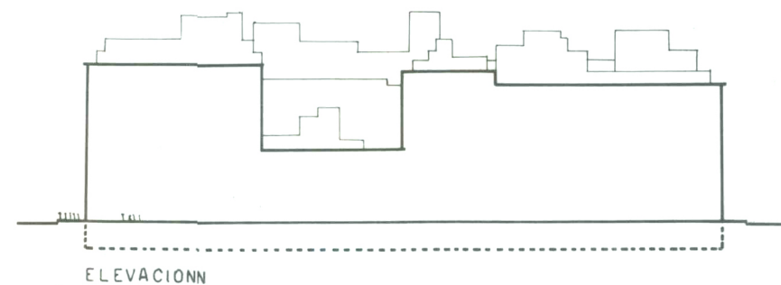
UNA CUADRA COLONIAL EN LA ACTUALIDAD

SE HACE NECESARIO LA CREACION DE UNA NUEVA MALLA URBANA