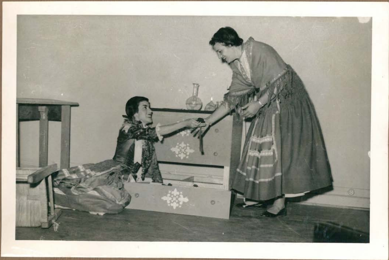
La Acacia y