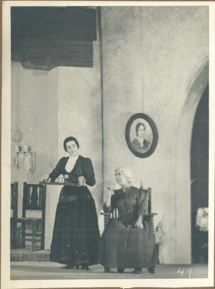
La Ramunda y