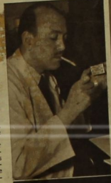
ROBERTO SARAH Camisa sucia y Limpia.