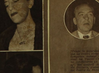
El teatro del Teatro Chileno tendrá funciones conjuntas...