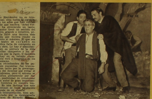
LA ESCENA DEL "ARBOLE VIEJO" EN EL TEATRO DE ENSAYO DE LA U.C.