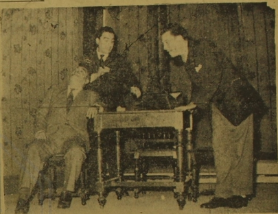
Intitulado ya en la Sala "Camilo Henrí- quez" del Círculo de Periodistas, Amanués, el 31, los actores del Teatro de Ensayo de la Universidad Católica ensayan una de las obras de "La Casamentera", de Thornton Wilder, comedia en cuatro actos que será representada a última instancia viernes 8 de julio.