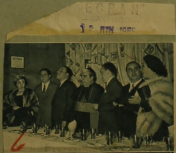
SE ENTREGA EL "CAMILO HENRIQUEZ"