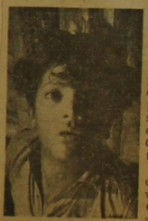
Este es el "Chirola", jefe de los pelusos que vagan por las calles de Santiago mostrando una realidad social que Alejandro Sieveking plantea en la obra que el Teatro de Ensayo presenta en premier, el sábado 19 en función de vermouth en su Sala Camilo Henríquez. Entradas en venta.