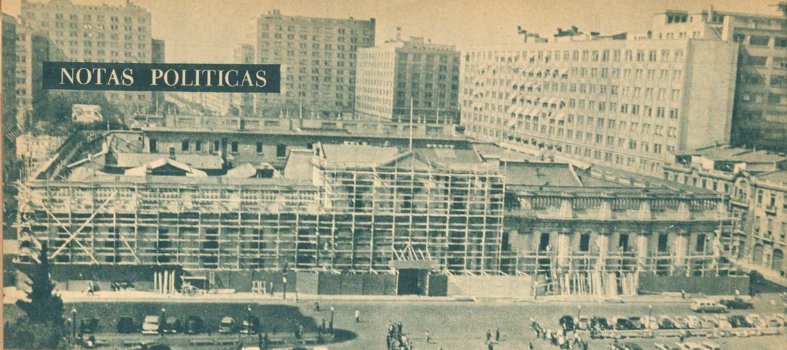
Refacción exterior de La Moneda, para aquel de los cuatro candidatos que llegue al poder en septiembre.