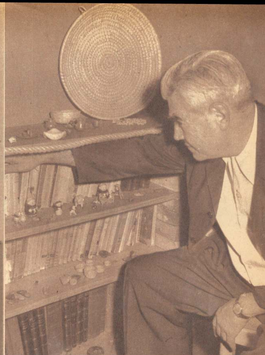
De las traducciones de "Hijo de Ladrón" sólo ha recibido derechos de la edición alemana, impresa en Austria, cuyos ejemplares señala en su biblioteca.

—Malthus opinaba que un hombre puede dejar de hacer cualquier cosa, menos comer y amar.