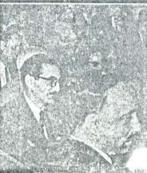
RECTORES EN ESTRENO SORPRESA Cassinoni, de la U. de Montevideo, y Frondizi, de la U. de Buenos Aires

El estreno estuvo programado para la función nocturna, y, ese mismo día, los nerviosos actores estaban dedicados a los últimos preparativos, cuando un mensaje de la rectoría les informó que se adelantaría para la venut, tendría carácter de función de gala y contaría con la asistencia de los rectores Ma-