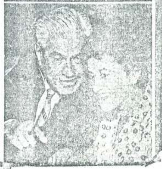
BINOMIO DE AUTORES ROJAS-AGUIRRE "Los conocimos de a poco, hace muchos años."

Porque el autor y el dramaturgo necesitan colocar a sus personajes en un ambiente o margen que sea conocido del lector o del espectador.