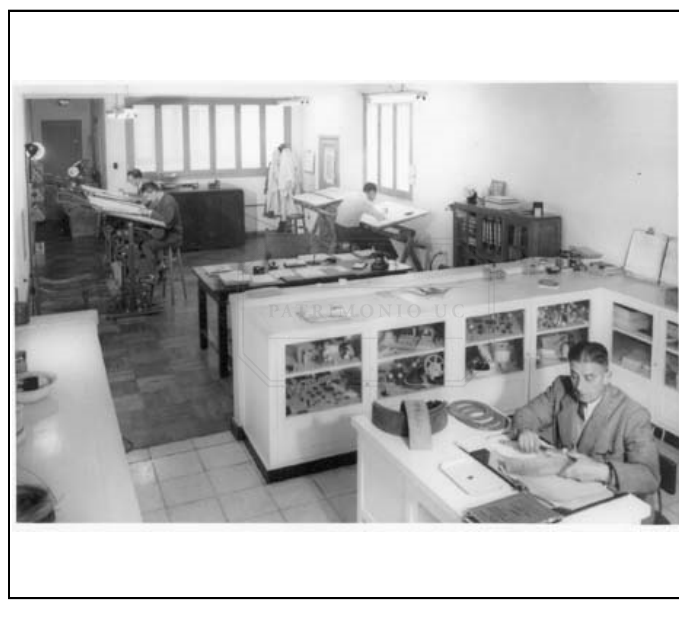
Fotografía b/n FPS - F01-0002