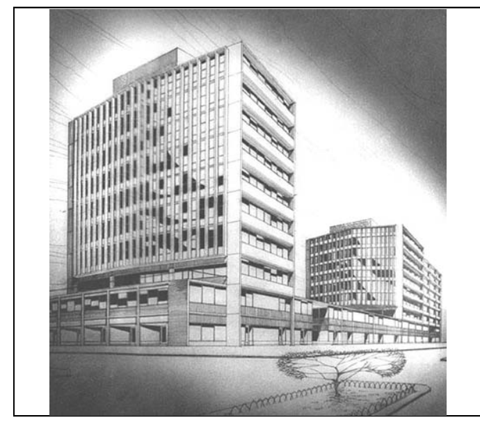
Fotografía b/n FJA - F04-0010