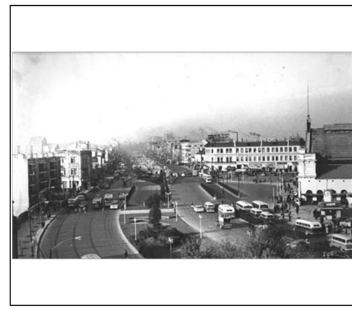
Fotografía b/n FJA - F04-0013