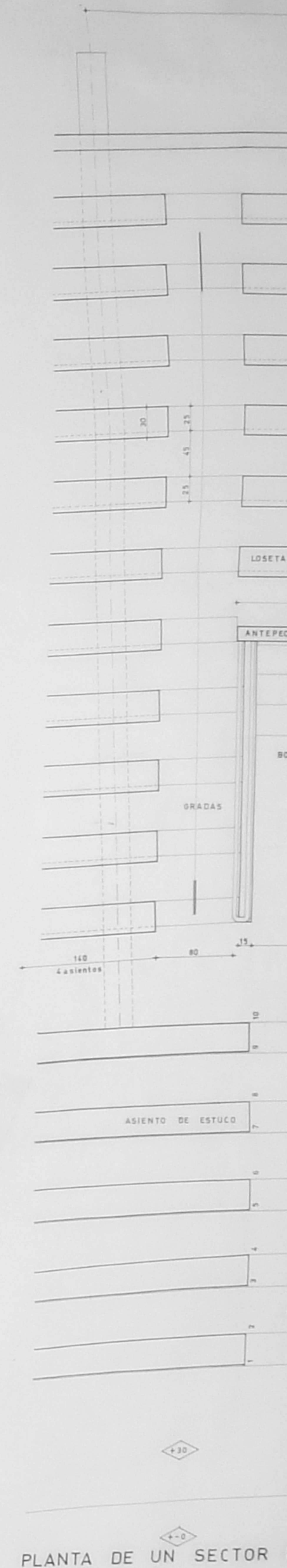
PLANTA DE UN SECTOR

CIRCULACION INTERIOR MURO DE PIEDRA EXISTENTE PUERTA DE LA MARATON RAMPA 12% PENDIENTE