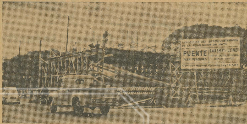
Estado de los trabajos de ejecución del puente para peatones entre ambas aceras de la avenida Figueroa Alcorta a la altura de la calle Agüero

Tanto la planificación general de la muestra como la construcción de los pabellones y su ornamentación se harán, según se informa, con un sentido moderno de la arquitectura,