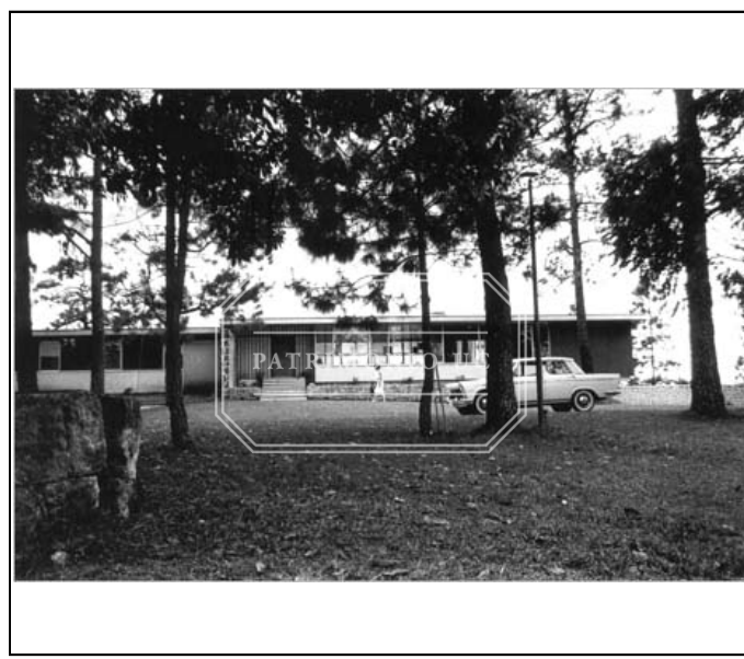
Fotografía b/n FJC - F01-0038