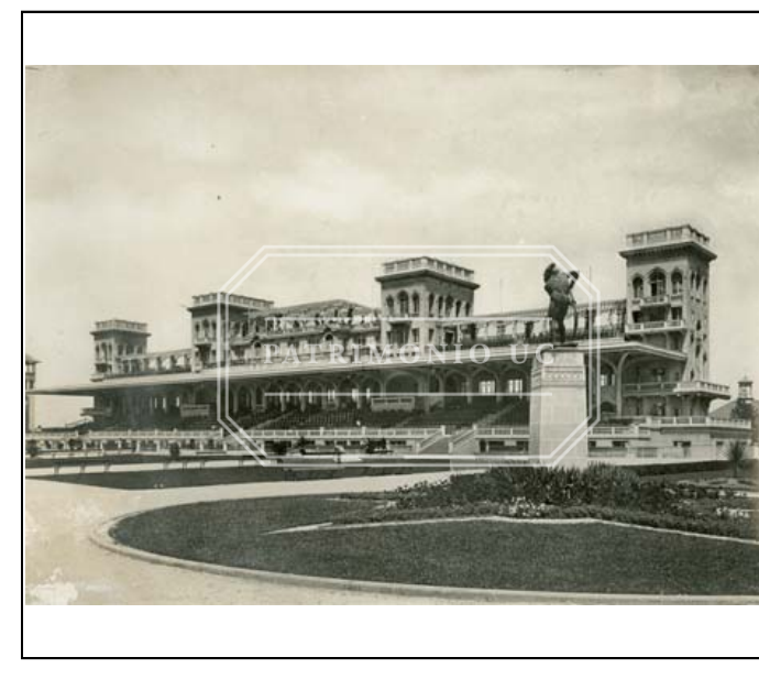
Fotografía b/n FJSS - F05-0051