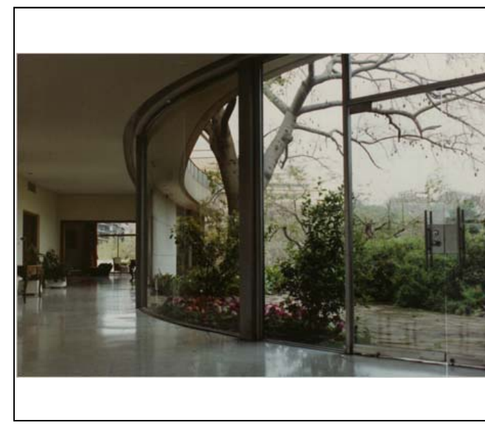
Fotografía color FECB - F01-0012