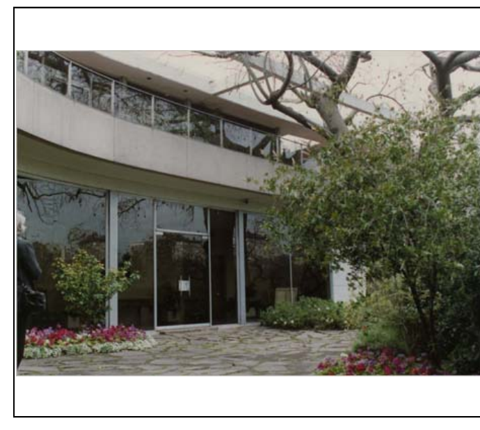
Fotografía color FECB - F01-0014