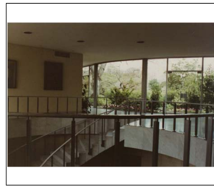
Fotografía color FECB - F01-0016