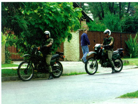
RECORRIDO COMUNAL, PAREJA DE CARABINEROS

Cada Centro de Operaciones contará con una pareja de carabineros entre las 8 A.M. hasta las 10 P.M. Durante la noche habrá una radio patrulla que atenderá un sector más amplio incluyendo a lo menos 4 o 5 juntas vecinales por cada vehículo.