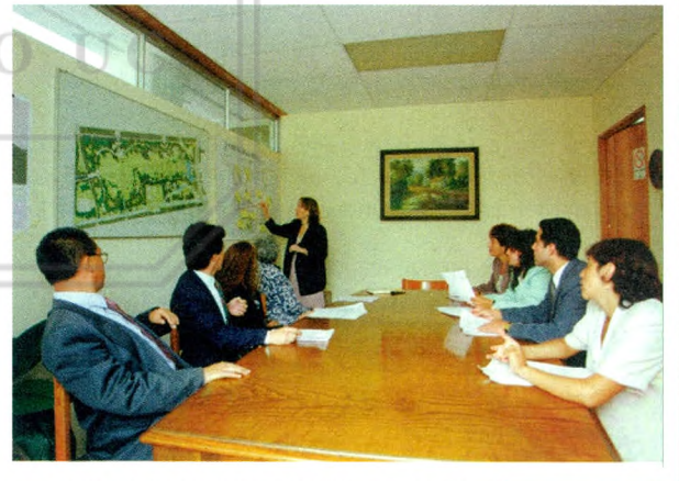
EQUIPOS DE INSPECTORES DELEGADOS POR EL ALCALDE

Tenemos la más plena confianza que nuestro vecindario sabrá despertar de su apatía y desesperanza, para abocarnos, todos juntos, a este proyecto que ha de ser fructífero y eficaz en la medida que acogamos al personal de carabineros en cada una de nuestras casas y barrios, como nuestros aliados y amigos con quienes debemos compartir, colaborar y alentarlos en el desempeño de sus tareas.