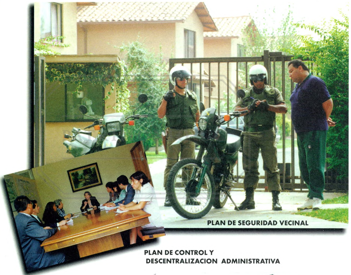
PLAN DE SEGURIDAD VECINAL

Ilustre Municipalidad de La Reina LOS TRES NUEVOS PROYECTOS DE 1998