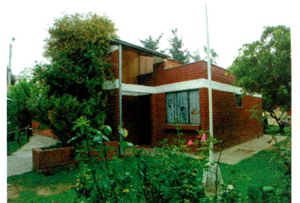
SEDE VECINAL, SEDE DE OPERACIONES

2. Dividir el espacio comunal en 12 sectores iguales en sus límites y población a los determinados para las operaciones de seguridad descritas anteriormente y que se muestran en el recuadro correspondiente, desde donde se realizarán las actividades que se describirán más adelante.