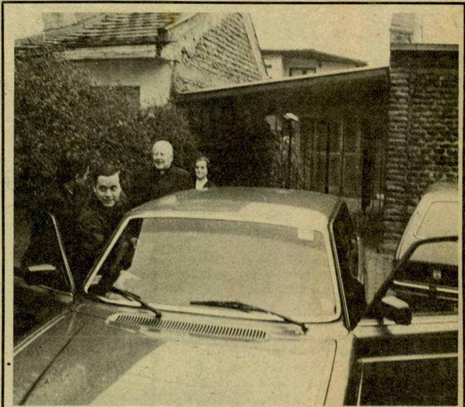
Monseñor Fresno se prepara para salir de su casa, a las 9.45 de esta mañana