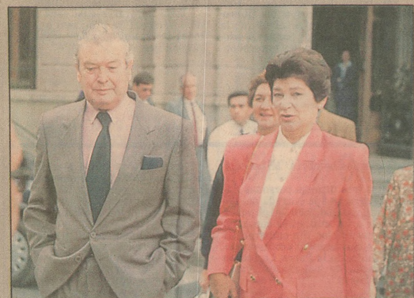
"Con el alcalde Ravinet tengo algunas discrepancias, pero conversando llegaremos a criterios comunes".

los días martes los dedica a audiencias populares y le gusta ir a terreno a ver las cosas con sus propios ojos. Esta semana, sin ir más lejos, no vaciló en partir manejando su propio automóvil, sin chofer ni escoltas ni guardaespaldas, a la Villa Francia, apenas supo que había problemas. Y se quedó allí hasta las cuatro de la mañana.