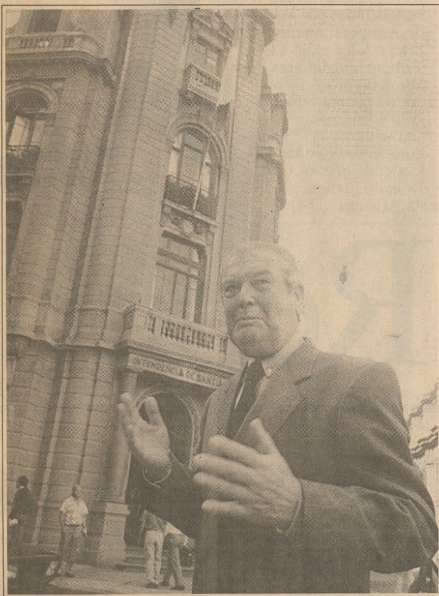
Cualquiera al observarlo podría creer que quienes conversan con el intendente son los personajes más connotados del mundo y no simples transeúntes.

—¿Sea, usted sueña con una ciudad donde los pobres vivan mezclados con los ricos? —Ojalá pudiera ser así, pero comprendo que el tamaño de la ciudad no permite una mezcla como antes, pero sí es posible generar sectores de viviendas que aprovechen la infraestructura que tienen los ricos —los parques, el transporte, las avenidas—. Eso lo tenemos en La Reina: la gente más pobre, de la Villa La Reina, está viviendo en el eje principal de la comuna, la avenida La