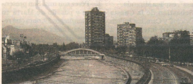
►► Torres de Tajamar (1962-1966): la idea era crear desde lejos el efecto de una unidad escultórica.