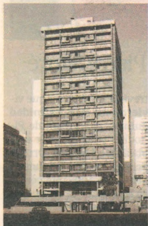
►► Entre 1965 y 1970 remodeló el área urbana de las Torres de San Borja.