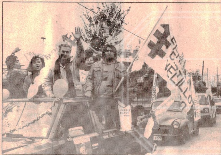
Caravana de Castillo

Una extensa caravana de no menos de 60 vehículos con entusiastas vecinos adherentes a la candidatura de Fernando Castillo Velasco, número 3 en la Lista A, recorrió las calles de la comuna de La Reina, donde el ex rector de la U. Católica y Premio Nacional de Arquitectura dejara una profunda huella de grandes realizaciones cuando ejerció esa alcaldía hace un par de décadas.