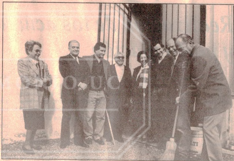
Candidatos de RN

Una extensa caravana de no menos de 60 vehículos con entusiastas vecinos adherentes a la candidatura de Fernando Castillo Velasco, número 3 en la Lista A, recorrió las calles de la comuna de La Reina, donde el ex rector de la U. Católica y Premio Nacional de Arquitectura dejara una profunda huella de grandes realizaciones cuando ejerció esa alcaldía hace un par de décadas.