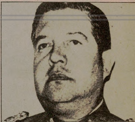
General (R) Manuel Contreras le dijo a hija de dirigente socialista fusilado: "Curioso que te llames igual que mi hija..."

● Al General implicado en el asesinato de Orlando Letelier parece lloverle sobre mojado: el viernes se interpuso primera querrela criminal por los crímenes de San Antonio.