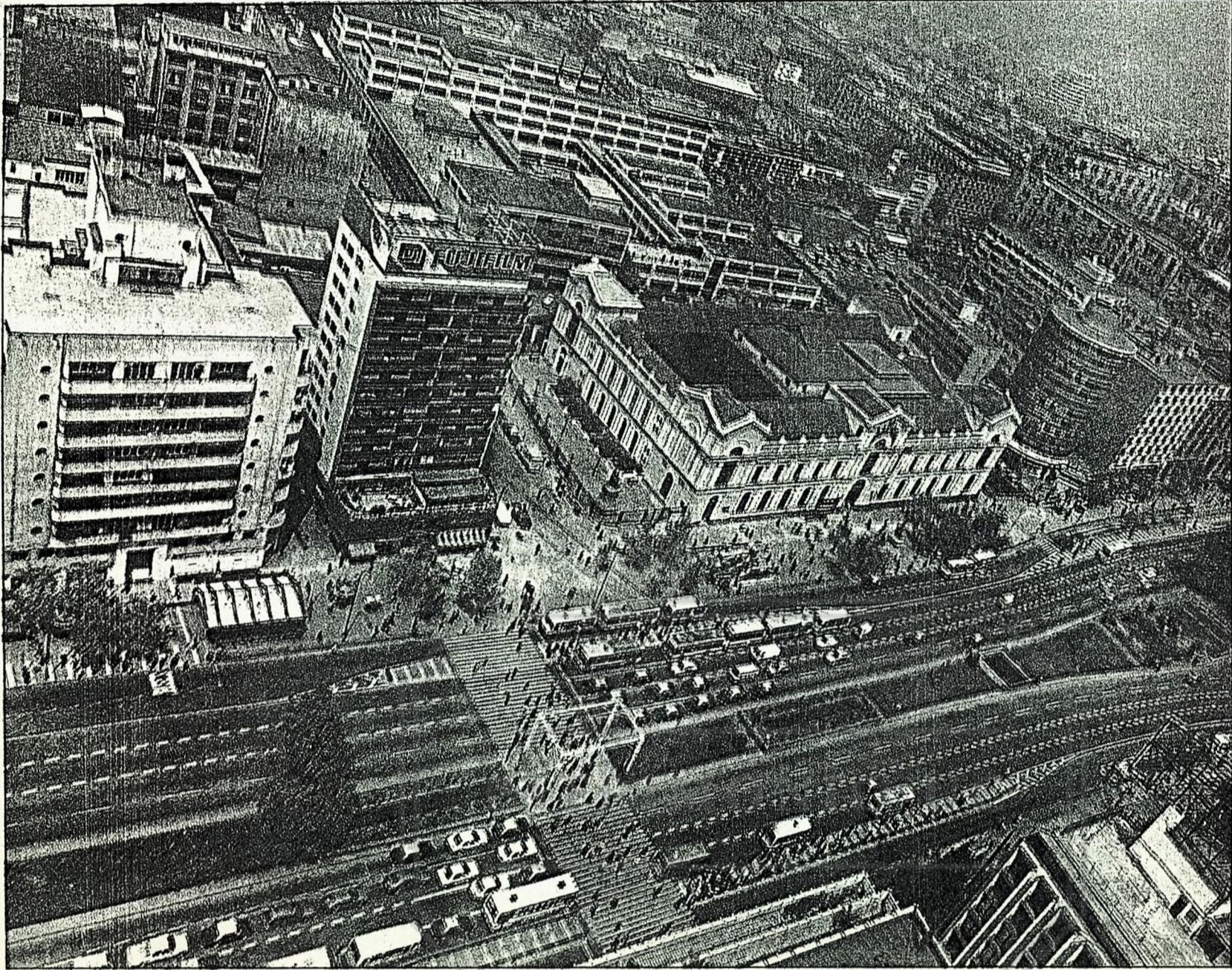
“En Avenida Matta estoy haciendo un proyecto de casas humildes, de 30 metros, pero con 3 pisos de alto. Cuando le hagan sus entramados, serán 90 metros y podrán vivir en un área con equipamiento y bien urbanizada”.

El futuro intendente de la capital es conocido por su sensibilidad con los sectores de menores recursos. Se espera que su gestión estimule las soluciones a la marginalidad y promueva el equilibrio entre las distintas comunas. La idea es que la segregación y las grandes diferencias económicas entre un sector y otro no sigan creciendo para que no tengamos que hablar de una ciudad dentro de otra.