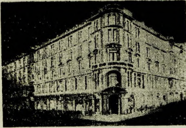
CASA DE AMERICA CRILLON Agustinas 1025 - Santiago, Chile