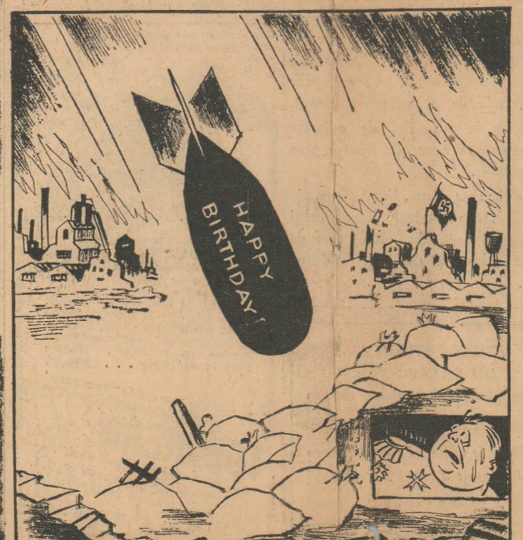
La R.A.F. a 25 ans