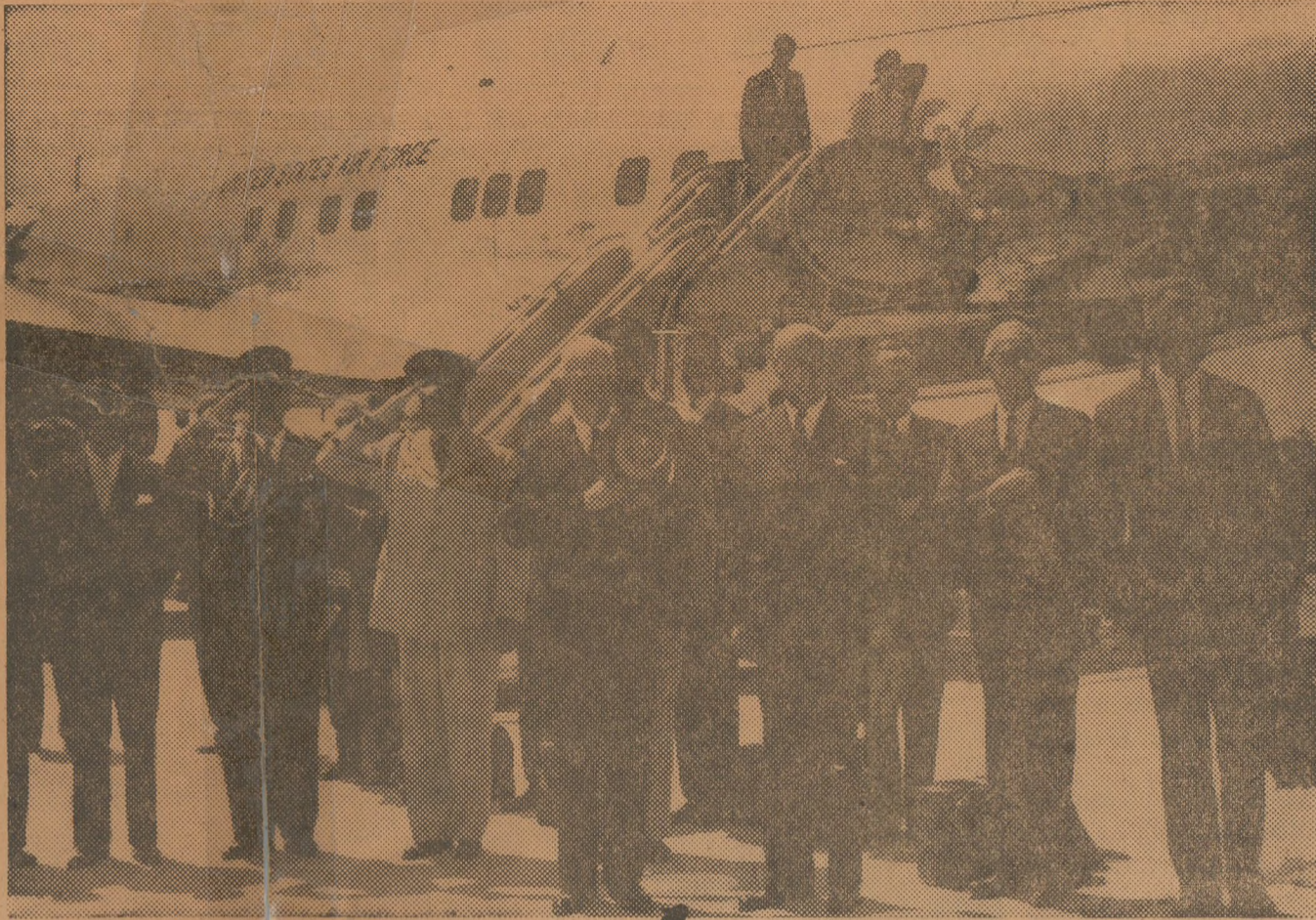
ESCUCHAN HIMNO DE USA. — Los Presidentes de Chile y los Estados Unidos, junto a sus edecanes y miembros de la comitiva visitante, escuchan el Himno Nacional norteamericano, que, ejecutado por la Banda de la Escuela de Aviación "Capitán Avalos", sirvió para rendir honores al Mandatario visitante. Atrás, el Super-Constellation "Columbine III", que aterrizó en Los Cerrillos, procedente de Liao-Liao (Argentina), a las 11.57 horas. Sus puertas se abrieron exactamente a las 12 horas, para que descendiera por su escalinata el Presidente Eisenhower.