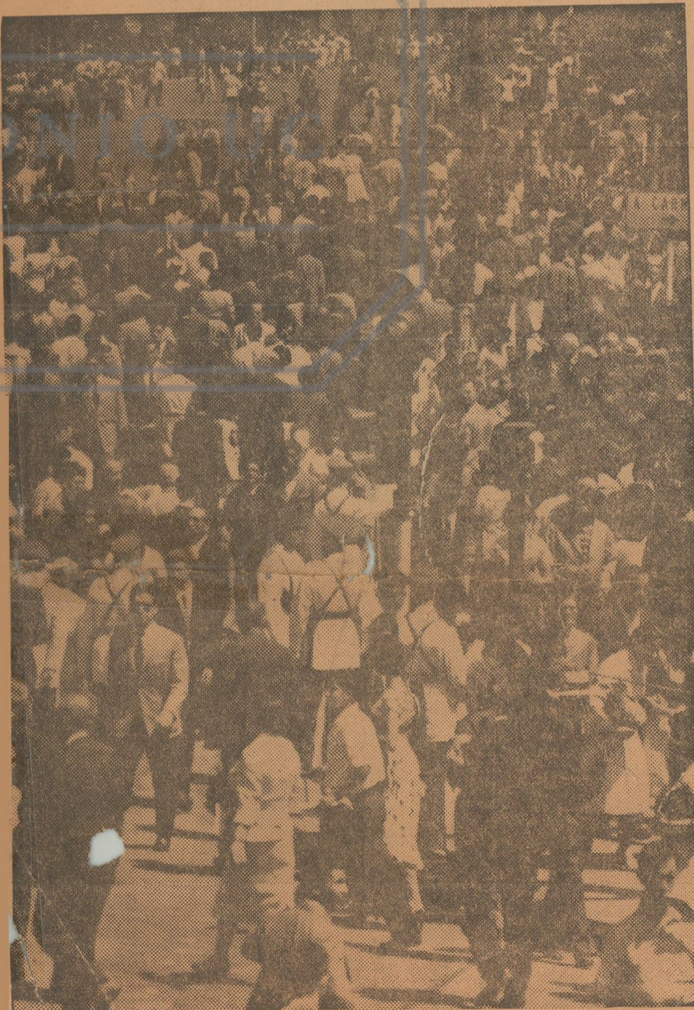
PERFECTO SANTIAGUINO. — El público desbordó las calles por las cuales atravesó el Presidente Eisenhower a su llegada a Santiago. A largo del trayecto que separa Los Cerrillos de la sede de la Embajada norteamericana en la capital, se reunieron más de cien mil personas a darle una cordial bienvenida al Mandatario visitante. Los norteamericanos que acompañan en su jira a Eisenhower