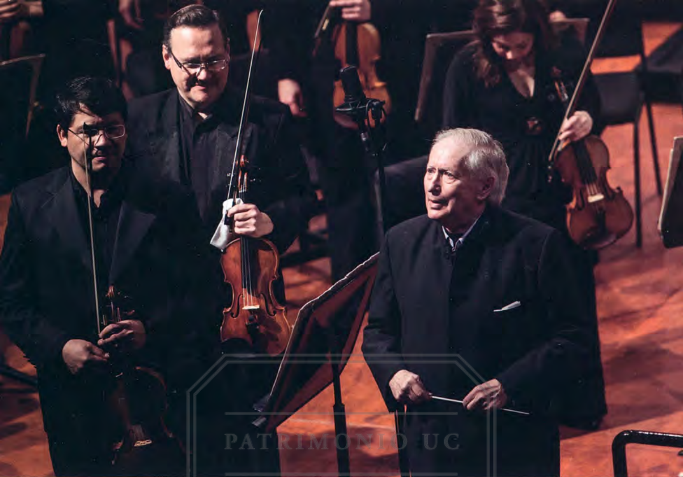
Thomas Sanderling recibiendo los aplausos del público en su anterior visita.

Por otra parte, su segundo concierto con la Sinfónica será con otra obra maestra de otro de los grandes y reconocidos compositores de todos los tiempos: Magnificat de Bach. ¿Qué puede comentar acerca de esta obra sacra?