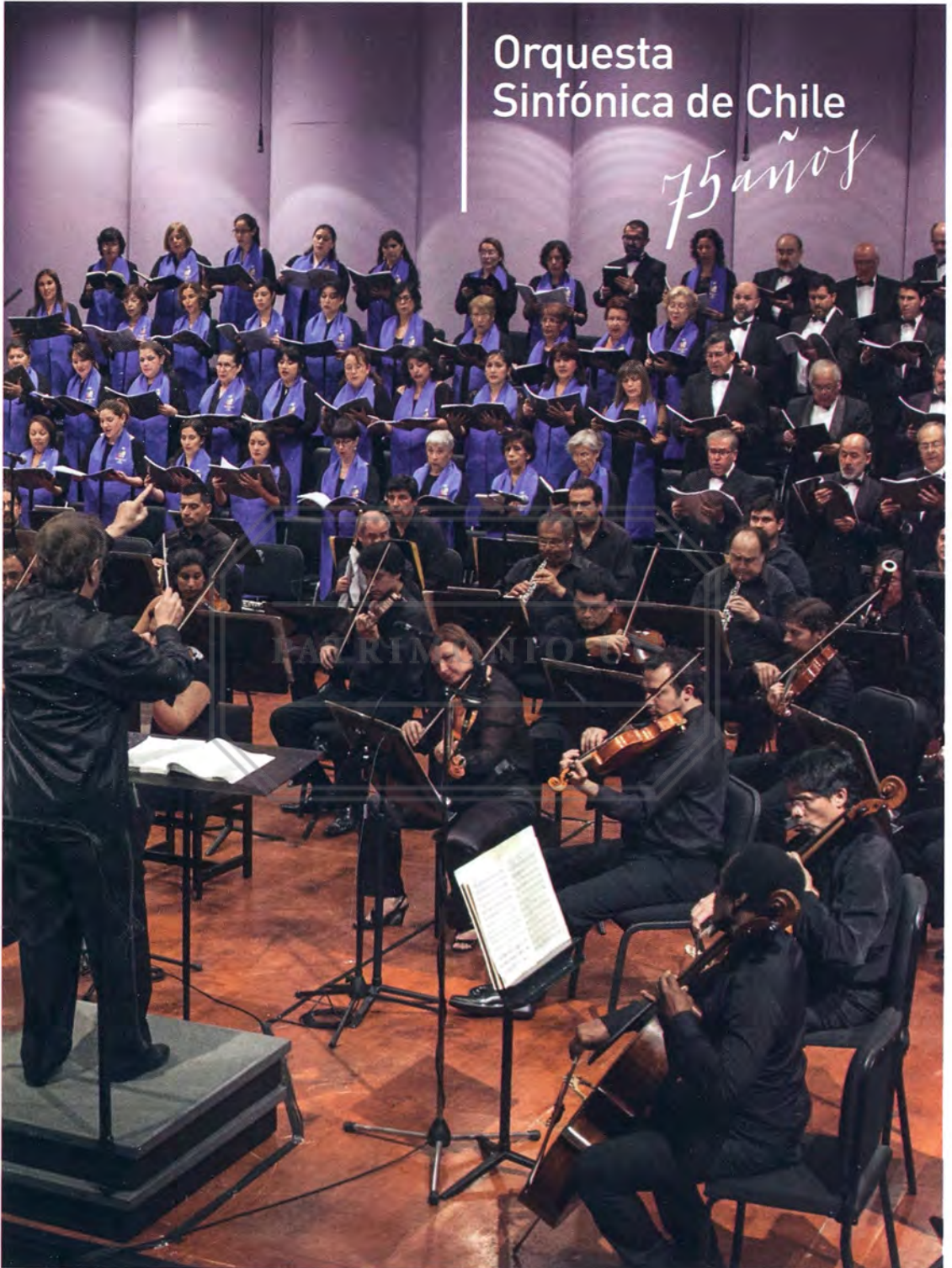
Leonid Grin dirigiendo al Coro Sinfónico y Orquesta Sinfónica de Chile