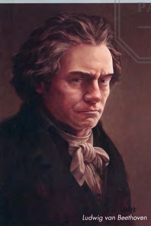
Ludwig van Beethoven

a su trabajo como músico de iglesia, tal como en sus primeros años en ciudades como Eisenach, Ohrdruf, Lünenburg o Weimar, cerrando de algún modo el círculo.