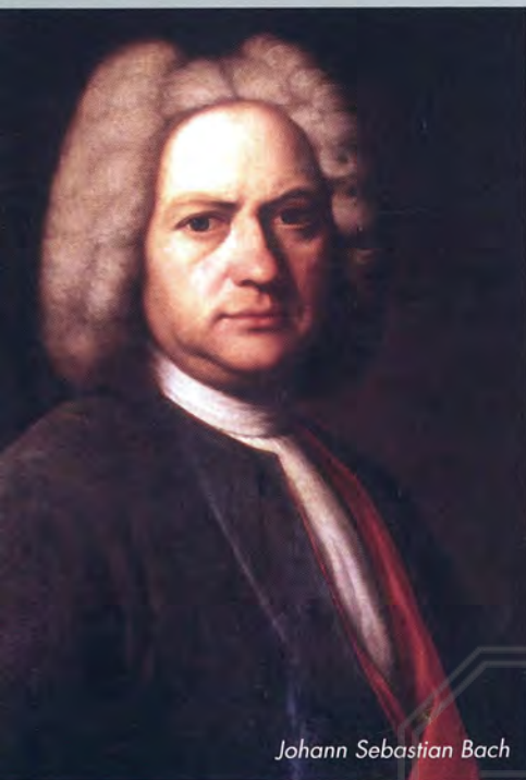
Johann Sebastian Bach