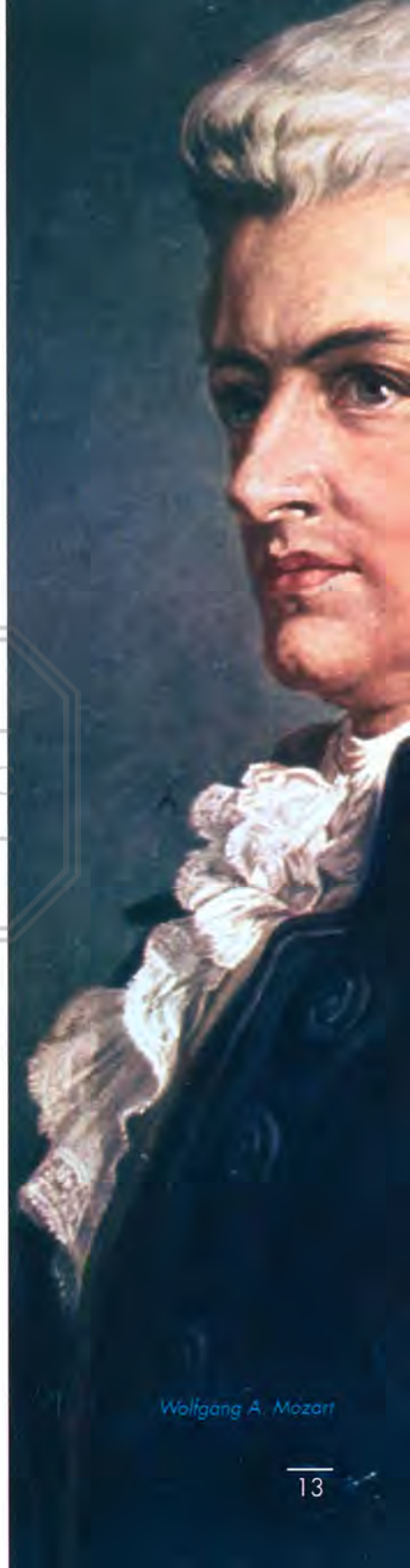
Wolfgang A. Mozart

Si bien existe un sinnúmero de leyendas que describen la etapa final de Mozart, lo cierto es que sus composiciones comenzaban