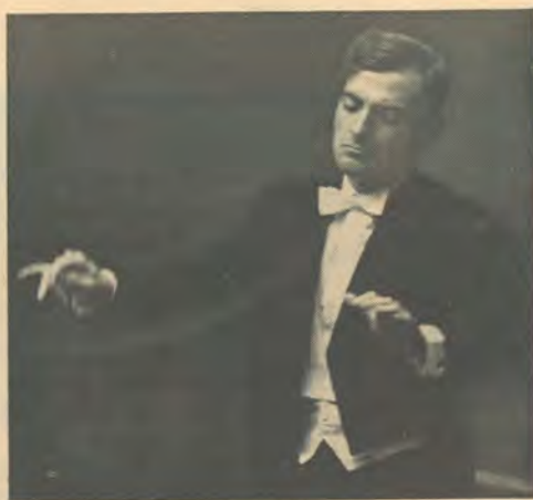
IZQUIERDO Poker near the chest.