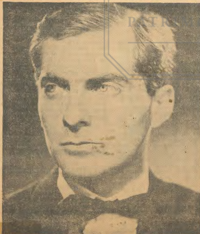
JUAN PABLO IZQUIERDO

Lombard, de 25 años, estudió con Ferenc Ericsay y actuó durante tres años con la Opera de Lyon. El año último dirigió la Orquesta de la Opera Comique de París y se ha presentado en Estados Unidos en varias oportunidades.