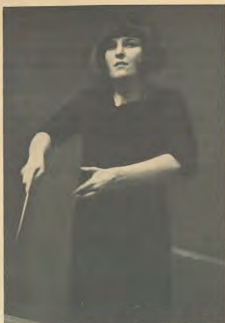
CARDUFF Woman with the wash.