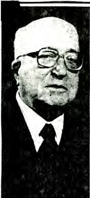
La obra "Preludios Dramáticos" del compositor chileno Domingo Santa Cruz ha escogido la Orquesta Filarmónica para su segundo programa.