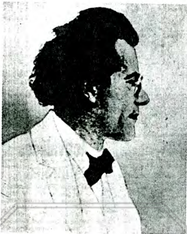
GUSTAV MAHLER, compositor y director austriaco.