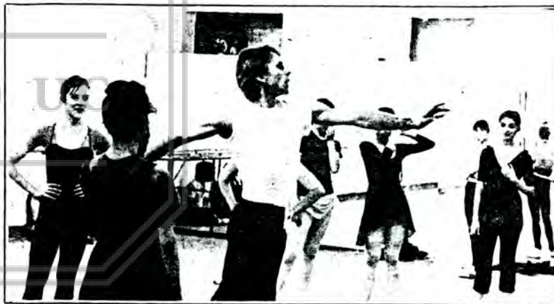
En plenos ensayos están los bailarines del Municipal.