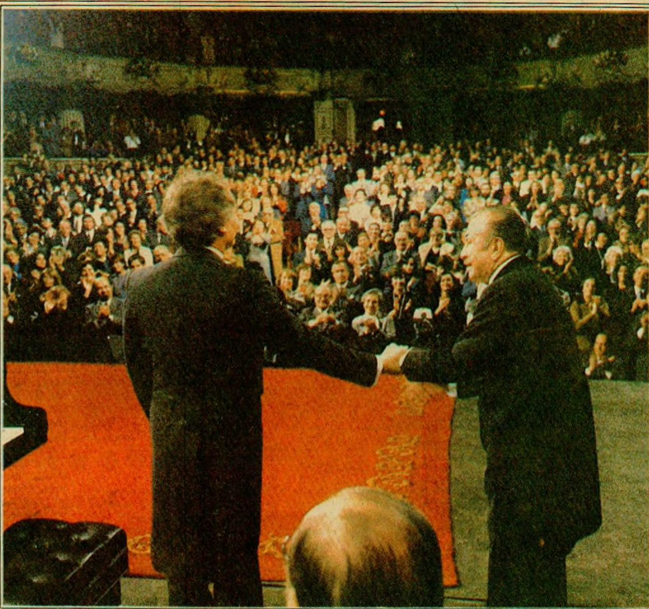
TRIUNFAL RETORNO. El público que colmó completamente el Teatro Municipal tributó ayer una delirante ovación final de pie a Claudio Arrau, quien virtualmente se vio imposibilitado de abandonar el escenario por prolongado tiempo ante ininterrumpidas manifestaciones de entusiasmo de sus admiradores. Las reacciones del público al término de la función fueron de emocionados elogios al veterano maestro. En la fotografía, el pianista nacional saluda junto al director de la Orquesta Filarmónica, Juan Pablo Izquierdo.