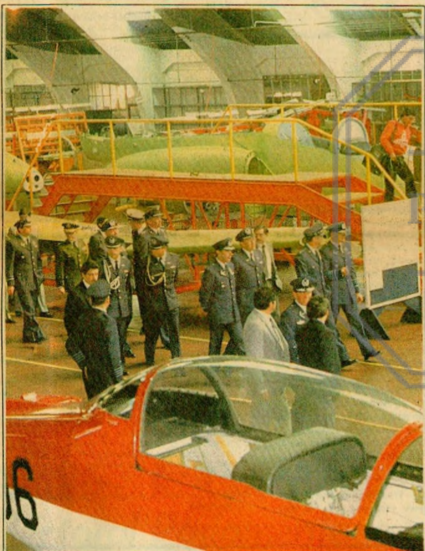
GENERAL NORTEAMERICANO EN CHILE. Llegó a Santiago, para una visita de poco más de 24 horas el Jefe del Estado Mayor de la Fuerza Aérea de EE.UU., general Charles A. Gabriel, quien se entrevistó con el alto mando de la FACH y visitó, entre otras instalaciones, la Empresa Nacional de Aeronáutica (en la foto), acompañado del general del Aire Fernando Matthei.