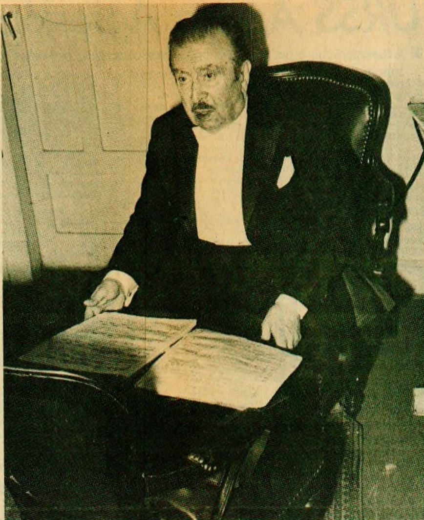
REPASO EN EL CAMARIN. — En esta foto, exclusiva de "El Mercurio", Claudio Arrau aparece en su camerín minutos antes de iniciar el concierto. Vestido con el frac con que saldrá al escenario, el maestro repasa las partituras que colocó en una silla frente a él.

"Es posible que en aspectos contingentes pueda producirse, en un momento determinado, una variedad de opiniones que resulta absolutamente normal cuando se piensa en que cada cartera tiene sus propias prioridades. Sin embargo, siempre ha primado el interés superior del país y el trabajo de coordinación ha funcionado muy bien desde el más alto nivel, que es el Consejo de Gabinete, hasta los contactos que los funcionarios tienen entre sí", concluyó.