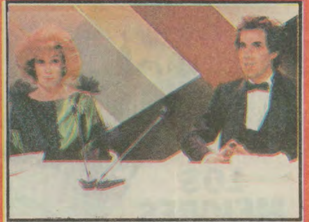
Los Eguiguren suceden al Doctor Nobel