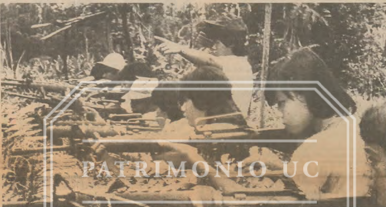
Un grupo de mujeres comunistas guerrilleras recibe instrucción en un campamento rebelde en la isla central de Samar, en Filipinas.

gencia comunista se debe en buena medida al mal manejo de la educación, la salud pública y la seguridad de las zonas rurales durante el gobierno del depuesto presidente Ferdinand Marcos.