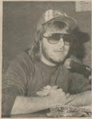
León Gieco, uno de los tres mosqueteros que grabarán a todo estadio en la cancha de Boca.

El espectáculo, denominado simplemente el concierto, incluirá actuaciones individuales de cada uno de los participantes, con su respectivo grupo, canciones compartidas y activa participación de los invitados, que incluirá a artistas argentinos y brasileños.