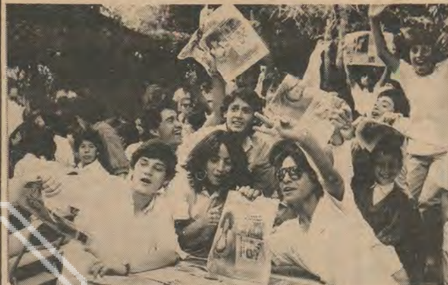
Así como fue el Picnic-Rock, ahora les regalamos a los lolos el Calendario Rock '87.

Extraoficialmente se sabe que los problemas habían surgido hace semanas entre ambos personajes, especialmente en la elección del repertorio para la temporada, al no ponerse de acuerdo en títulos y autores.