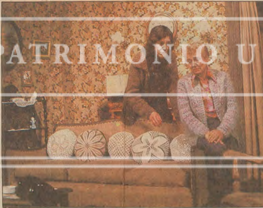
"Buenas Noches, Mamá" es una de las once obras para adultos que se ofrecerán en la Temporada de Teatro del Parque Bustamante