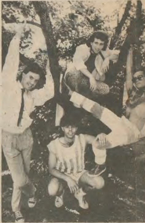
"Valija Diplomática" estará el último domingo de este mes inaugurando los recitales rock.

Estos mismos conciertos se repetirán posteriormente en la Disco Avenida, co-