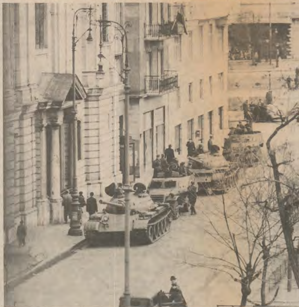
La sociedad húngara se cerró tras el aplastamiento de la revolución, hace 30 años. La tasa de suicidios pasó a ser la más elevada del mundo, triplicándose en los últimos 15 años. Anualmente, cinco mil personas se quitan la vida y 70 mil lo intentan, en una población de 10,5 millones.

Nada se ha resuelto, verdaderamente, desde 1956. Ni tampoco en Checoslovaquia o Polonia. Los húngaros, checos, eslovacos y polacos viven del modo que lo hacen porque