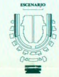
Precio 4: Anfiteatro general, palco 2o piso 2da fila central, Palco 2o piso lateral 2 fila (N° 1al12).