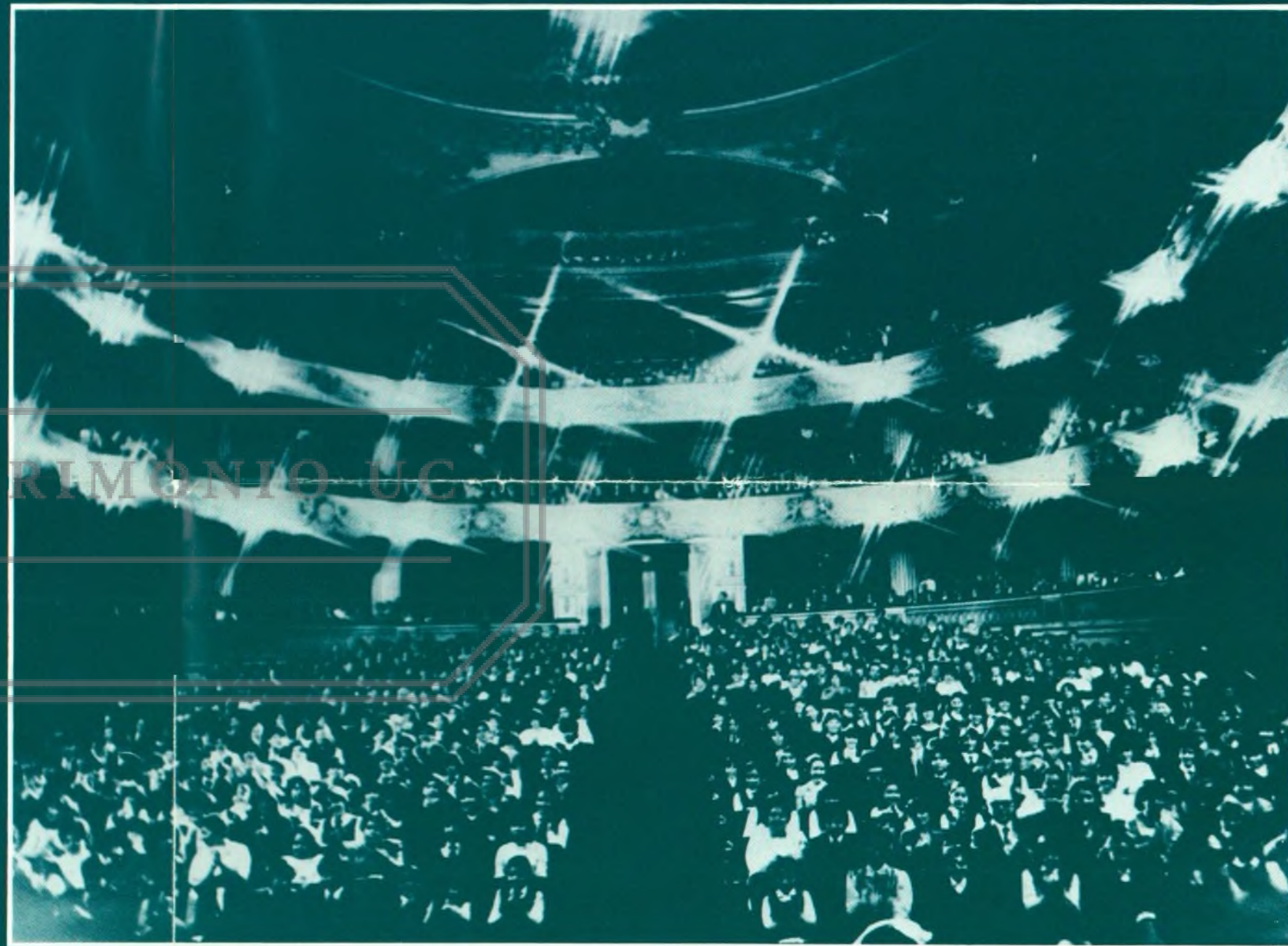
Una de las veinte funciones gratuitas destinadas a escolares, durante 1984.