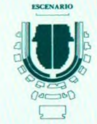
Precio 1: Plateas palco 1er piso frontal, palco 1er piso lateral 1a fila, palco 2o piso frontal.