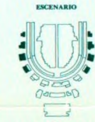
Precio 5: Balcón lateral 3er piso.