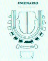
Precio 2: Balcón frontal 3er piso.