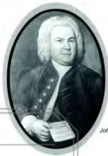
Johann S. Bach

Vivió en la Alemania protestante del norte, en los días en que la música constituía una parte importante del esplendor de las cortes, de la dignidad municipal y del culto religioso. Bach ocupó sucesivamente los puestos de miembro del coro de niños, violinista en la orquesta de un príncipe, organista de iglesias de pueblo, director musical en una corte y cantor de una escuela municipal con la obligación de ocuparse de la música de las iglesias vinculadas a ellas; este último cargo lo ejerció en Leipzig, a cuya escuela e iglesia de Santo Tomás está relacionado su nombre. Aquí permaneció durante los últimos veintisiete años de su vida, tocando, adiestrando coros, y componiendo sin cesar hasta su muerte, ocurrida en 1750.