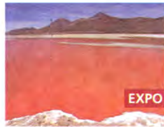
Entre el Cielo y la Tierra Guy Petermann Fotografía

Exposición permanente Salas de Exposición Corporación Cultural