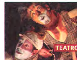
El gato que le enseñó a volar a una gaviota

Tres gatos de puerto se ven atareados al hacerse cargo de un polluelo de gaviota. No son pocos los problemas que divertidamente tienen que resolver en esta obra teatral familiar, maravillosa fábula de la Compañía Teatro del Sol, inspirada en la novela homónima del destacado escritor chileno Luis Sepúlveda.