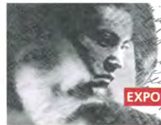
Sonetos de la muerte Romelio y Lucila Eleonora Casaula Fotografía

3 al 26 de Junio Salas de Exposición Corporación Cultural