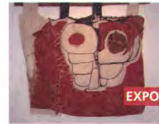
Circular cuatro Susana Espinosa Arte textil

3 al 26 de junio Salas de Exposición Corporación Cultural