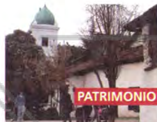
Centro Artesanal Los Dominicos

Emplazado en el corazón de la comuna, el Centro Artesanal Los Dominicos se ha transformado en visita obligada de turistas y visitantes ilustres. Su distintivo con, las dos torres de la iglesia, es ya una marca registrada y lo hace reconocible en todo el mundo. Se estructura como un pequeño pueblo colonial y en sus estrechas calles de tierra es posible encontrar artesanía y objetos de arte provenientes de todas las regiones del país.