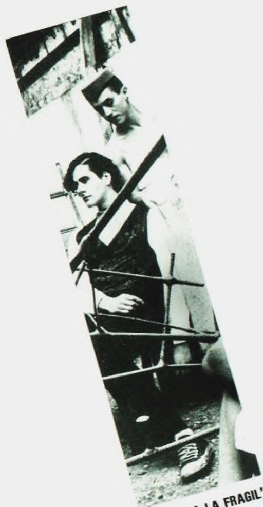
"CARLOTTA LA FRAGIL"