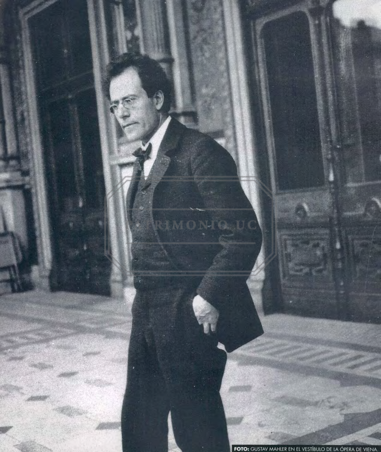
FOTO: GUSTAV MAHLER EN EL VESTÍBULO DE LA ÓPERA DE VIENA