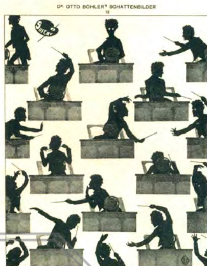
FOTO: MAHLER ALCANZÓ MAYOR FAMA COMO DIRECTOR DE ORQUESTA QUE COMO COMPOSITOR. AQUÍ ES POSIBLE APRECIAR UNA CARICATURA DE SOBRE SUS ESTILOS DE CONDUCCIÓN. OTTO BÜHLER, 1900

Nueva Costanera 3676 / Vitacura, Santiago de Chile Tel: (56-2) 2206 0892 / 2206 5557 • www.dacarla.cl