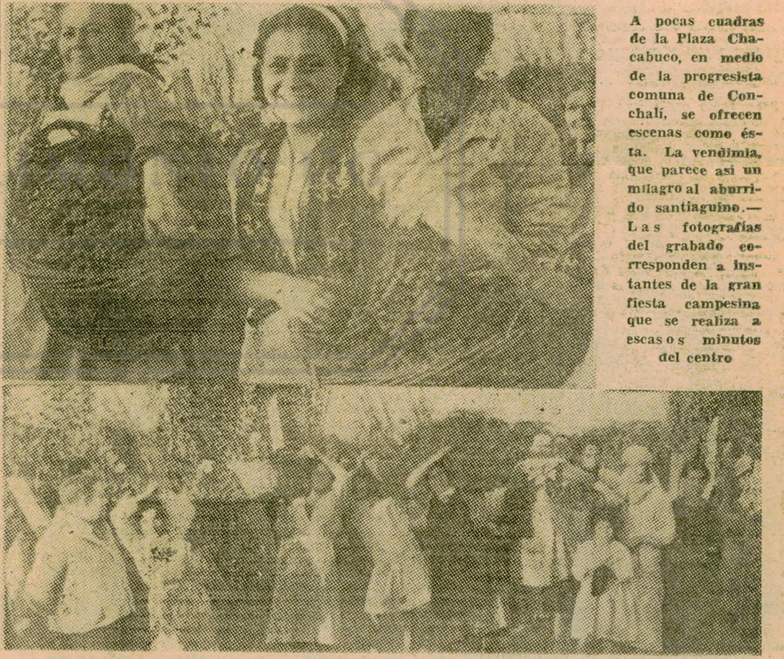
A pocas cuadras de la Plaza Chacabuco, en medio de la progresista comuna de Conchalí, se ofrecen escenas como ésta. La vendimia, que parece así un milagro al aburrido santiaguino. — Las fotografías del grabado corresponden a instantes de la gran fiesta campesina que se realiza a escasos minutos del centro

Un milagro del campo casi en la misma ciudad