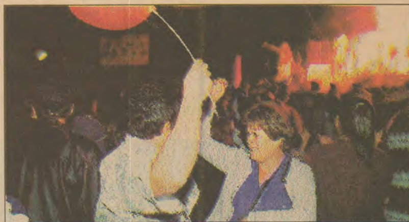
PACHANGA.— Nótese el zarandeo leve y coquetón al que invita la cumbia.